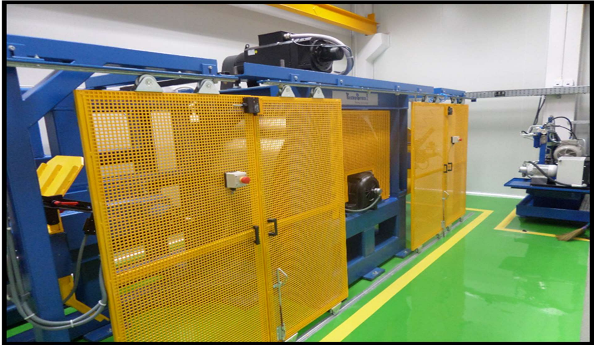
เครื่องทดสอบสมรรถนะความเร็วและการรับโหลด รถจักรยานยนต์ (มอก.2720, UN R 75)